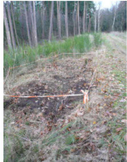
Unspektakulär, aber besonders wertvoll: Ein wenige Quadratmeter großer Wuchsort der Ästigen Mondraute im Landkreis Roth.

In enger Zusammenarbeit mit der Höheren Naturschutzbehörde und örtlichen Botanikern kümmert sich der Landschaftspflegeverband um die Erhaltung der Wuchsorte von insgesamt 36 stark gefährdeten Pflanzenarten wie beispielsweise des Spatelblättrigen Greiskrauts oder der Niedrigen Schwarzwurzel. Hierbei handelt es sich oft um Kleinstmaßnahmen auf nur wenigen Quadratmetern Fläche. Im Rahmen eines Betreuungsvertrages stellt die Regierung v. Mfr. Fördermittel für die oft sehr aufwändige Pflege und für den Betreuungsaufwand zur Verfügung.