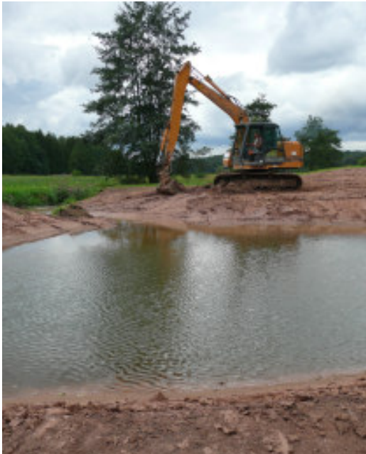
Anlage einer Tümpelkette am Fembach (Gde. Puschendorf, Lkr. Fürth)

Im Bereich der klassischen Landschaftspflege und Biotopgestaltung wurden 1,25 Millionen Euro umgesetzt, das sind etwa 23 % mehr als im Vorjahr . Von dieser Summe gingen wiederum über 75 % an die vom Landschaftspflegeverband beauftragten landwirtschaftliche Betriebe in Mittelfranken. Weitere 500.000 € können dazu gerechnet werden, die im Rahmen betreuter Projekte direkt von den Naturschutzbehörden an die Landwirte ausbezahlt wurden (Vertragsnaturschutzprogramm im Wiesmet, Altmühltal und Frankenhöhe).