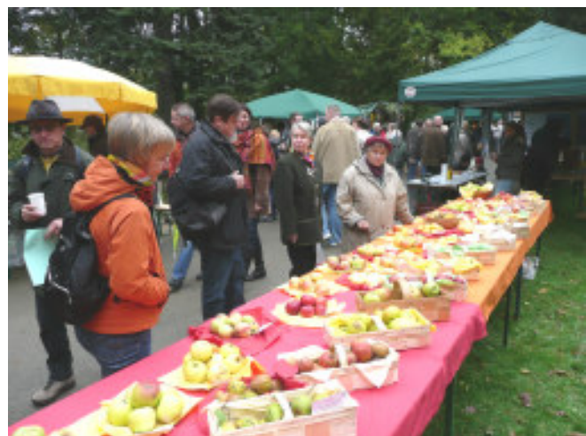
Obstausstellung beim 9. Fürther Apfelmarkt