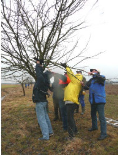
Bürgeraktion Obstbaumschnitt in Fürth mit 30 Ehrenamtlichen