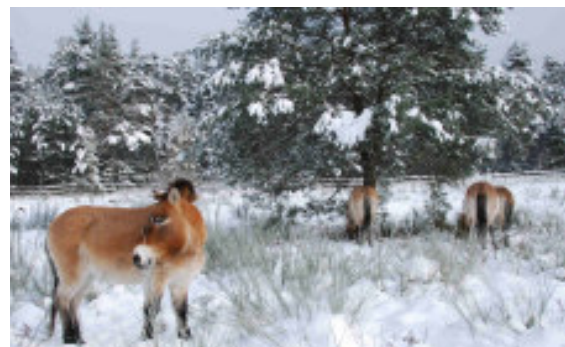
Przewalski-Urwildpferde im Schnee

Nach vier Neuzugängen aus dem Tiergarten Nürnberg und dem Tierpark Hellabrunn weiden derzeit neun Przewalski-Hengste im Naturschutzgebiet. 352 Erwachsene und 131 Kinder nahmen an den 24 Führungen im Gebiet teil. Zusätzlich wurde wieder eine "Wüstenexpedition" angeboten, und das Projekt bei mehreren Infoständen und Vorträgen präsentiert.