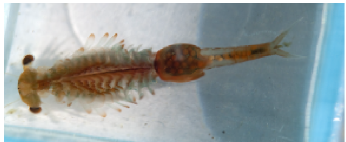
Weibchen des Frühjahrs-Kiemenußes mit deutlich erkennbarem Eiersack.

Der Frühjahrs-Kiemenuß ist ein 200 Millionen Jahre alter „Urzeitkrebs“, der eine zyklische Überlebensstrategie besitzt: Die ausgewachsenen, bis zu 3 cm großen Exemplare kommen nur im zeitigen Frühjahr auf, um sich zu vermehren, und verschwinden bis zum Mai, um in Form von Dauereiern am Gewässergrund zu überleben. Die kurze Lebensdauer der Krebse und ihr Lebensraum –