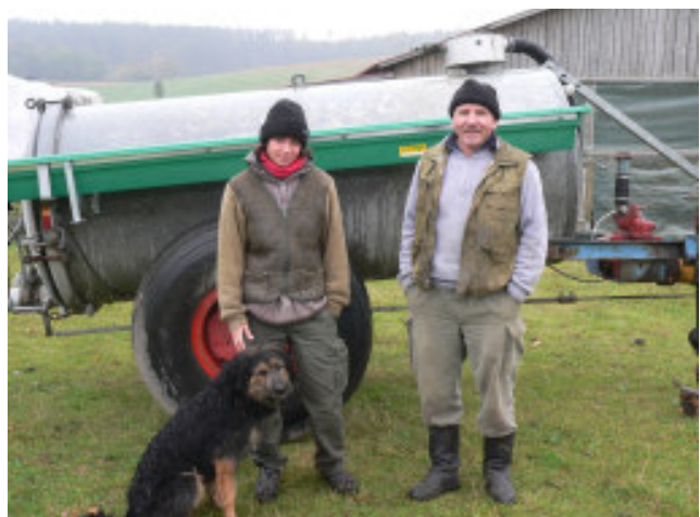
Mobile Schaftränke für das Schäferrevier Windischhausen

Kern des von der Regierung von Mittelfranken geförderten Umsetzungsprojekts ist es, die zehn Hüteschäfer der Hahnenkammgemeinden zu unterstützen und Lösungen zur Sicherung der dauerhaften Beweidung der wertvollen Magerrasen zu finden. So wurde 2009 beispielsweise ein ausgedientes Güllefass angeschafft und zu einer mobilen Schaftränke umgebaut, mit der nun die Schafe auf 10 Hutungsflächen im Revier Windischhausen versorgt werden können.