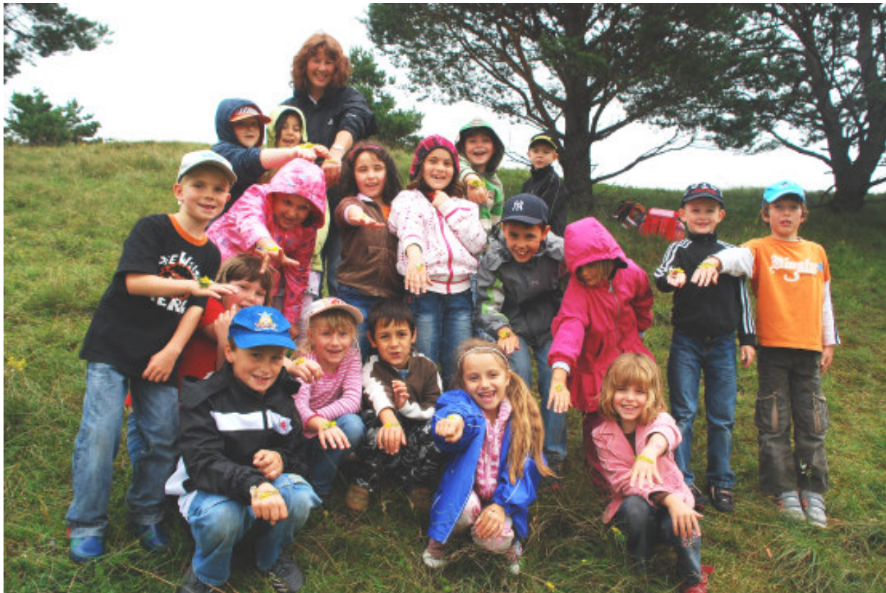
„Farben sammeln“ auf der Schafhütung im Projekt „Artenvielfalt für Schulkinder“

Feuchtwanger Straße 38 91522 Ansbach Telefon: 09 81/46 53-35 20 Telefax: 09 81/46 53-35 35 info@lpv-mfr.de www.lpv-mfr.de