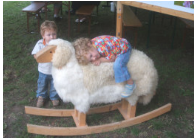
Das „Altmühltaler Schaukelschaf“ lockt vor allem die kleinsten Besucher zu den Infoständen des Landschaftspflegeverbands.

Mit dem Zusammenhang zwischen Ernährung und Klimaschutz befassten sich eine Ausstellung und ein Quiz am Gemeinschaftsstand von Landschaftspflegeverband und Amt für Umweltplanung auf dem 9. Fürther Apfelmarkt . Auf besonders großes Interesse stieß die Ausstellung von 70 Obstsorten, die mit freundlicher Unterstützung des Fränkischen Freilandmuseums aufgebaut werden konnte.