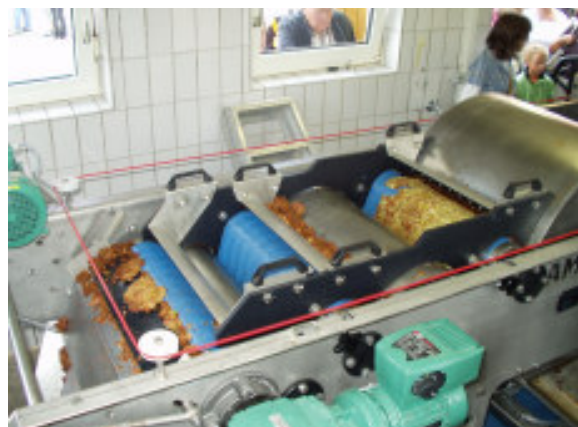
Siebbandpresse in der neuen Schnelldorfer Mosterei

Auf Initiative des Landschaftspflegeverbands formierte sich in Schnelldorf im Januar 2009 ein Bündnis zur Einrichtung einer Gemeinschaftsmosterei. Zusammen mit der Gemeinde und einem engagierten Team aus Aktiven wurde im März eine Genossenschaft gegründet, und bereits zur Obstsaison 2009 konnte das neu geschaffene „Obsthaisla“ in Betrieb gehen. Mit dem Genossenschaftsmodell wurde allen Obst- und Gartenbauvereinen der Gemeinde Schnelldorf, aber auch vielen Bürgerinnen und Bürgern die Möglichkeit der Beteiligung gegeben. Damit verfolgt die Idee der Gemeinschaftsmosterei mehr als nur die Verwertung örtlicher Obsttrübe; sie schafft auch Möglichkeiten eines neuen Miteinanders über Ortsgrenzen hinweg.